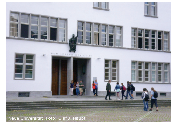
Neue Universität.