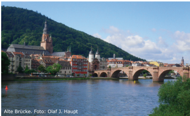
Alte Brücke.